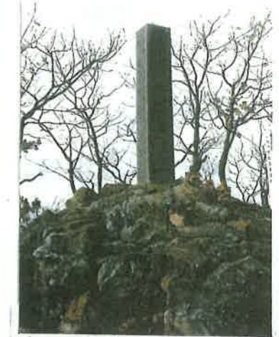
⑧ 近文山「国見の碑」 (旭川市指定文化財)