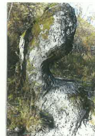
⑥ 魔神の首 (ニツカムイ・ガ)