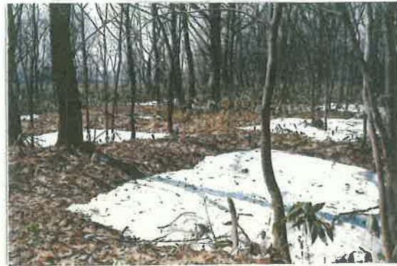
① 神居古潭竪穴住居遺跡 (北海道指定文化財)