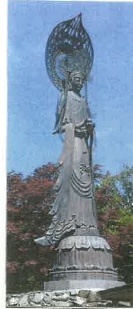
⑩ 神居古潭夢殿観音菩薩