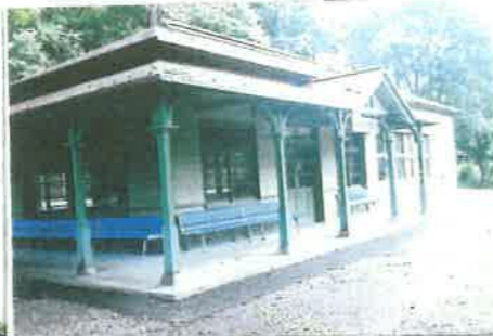
② 旧神居古潭駅舎 (旭川市指定文化財)