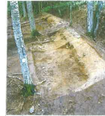
⑪ オトイパウシチャシ