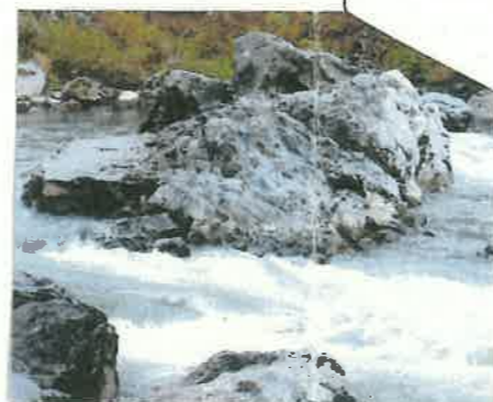
⑦ テシ (築柵) と大おう穴