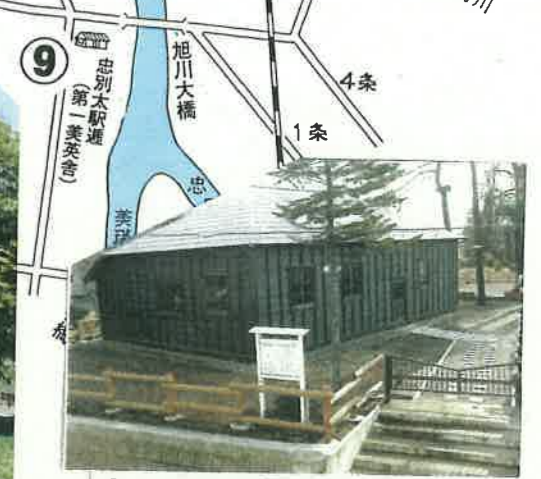
⑨ 忠別太駅連第一美英舎 (旭川市指定文化財)