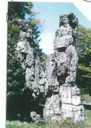
⑩ 立岩 (イ・タシマ)