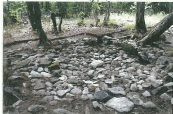
④ 神居古潭ストーンサークル遺跡